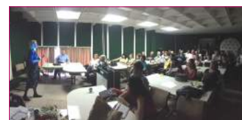
Simpozijum je bio dobro posećen.