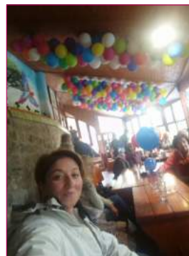
Ružno vreme nije sprečilo Užičane da dođu u Beograd i prisustvuju obeležavanju Svetskog dana borbe protiv artritisa.

Ove godine je podružnica Užice obezbedila finansijska sredstva za svoja dva člana na Kongresu UReS/ORS.