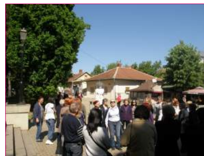
Članovi ORS-a se rado odazivaju pozivu za izlet.