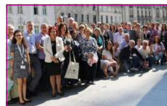
Učesnici 5. konferencije Agore na okupu.

- Očekivanja i izazovi u primeni procesa donošenja zajedničke odluke: perspektiva doktora i