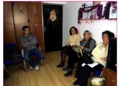
Učesnici su uvek raspoloženi za priču tokom kursa.