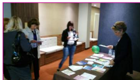
Članice podružnice Novi Sad su pomagale na štandu ORS-a tokom Kongresa UReS/ORS