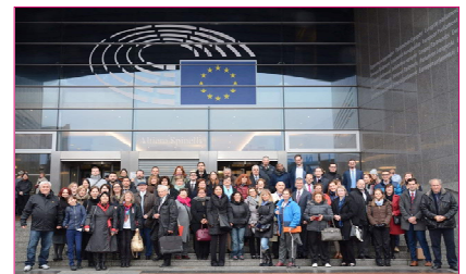
Učesnici konferencije ispred Evropskog parlamenta

Kompletan izveštaj sa konferencije možete naći na sajtu www.ors.rs .