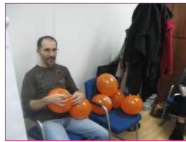
Interesantan način da se reše problem, samo je potrebno imati balone... i rešenje.

I ove godine treneri su organizovali novogodišnje okupljanje za učesnike sva četiri seminara. Uz razgovor i dobro raspoloženje prisutni su uživali u dvoipčasovnom druženju.