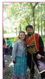
Izletu su se pridružile medicinske sestre iz Instituta za reumatologiju, koje su zajedno sa članovima ORS-a uživale u Igrokazu o Karađorđu.

Tokom obilaska između članova ORS-a i vodiča Slobe stvorila se velika obostrana simpatija. Na predlog pojedinih nasih članova Sloba je