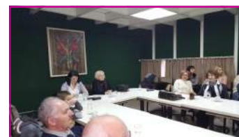
Uprava podružnice Niš je zaslužna za organizovanje svih aktivnosti u podružnici.