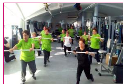
Članovi Kluba Reuma Našice aktivno vežbaju i svoje vežbanje predstavili su na skupu.