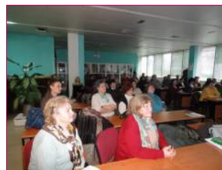
Predavanje u ogranaku podružnice Novi Sad - Zrenjanin