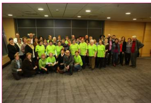
Učesnici su bili vrlo zadovoljni sastankom.