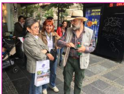
Članovi ORS-a su došli da podrže događaj bez obzira od koje bolesti boluju.