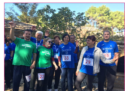
Pripreme za Reumatlon