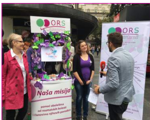
Uživo uključenje u popodnevnu emisiju nacionalne televizije.

Za 2017. su planirane dalje aktivnosti namenjene obolelima od lupusa.