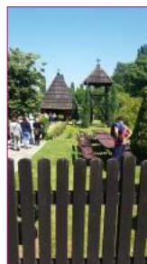
Članovi ORS-a su uvek zadovoljni kada mogu da posete neki manastir ili neku istorijsku znamenitost

bio još 2 h sa nama u Etno selu, gde je nastavio sa predavanjem o Srpskoj istoriji.