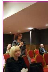
Prdsednica podružnice VMA je uzela učešće u diskusiji tokom Kongresa UReS/ORS.

Aktivisti podružnice VMA su učestvovali u svim značajnijim aktivnostima Centralne kancelarije.