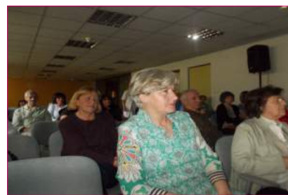
Predavanje održano u okviru podružnice Užice je bilo vrlo posećeno.