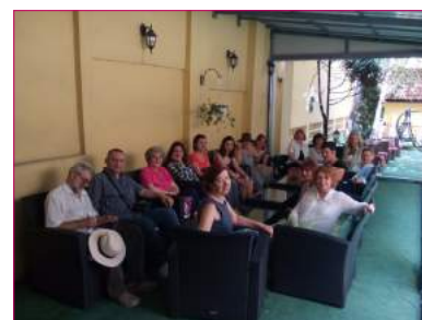
Organizovano je i druženje pred letnju pauzu svih učesnika radionica.