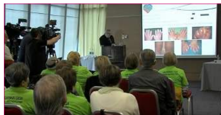
Učesnici sastanka iz Bosne i Hercegovine, Crne Gore, Hrvatske, Slovenije i Srbije.

Susret se završio prijatnim druženjem uz večeru.