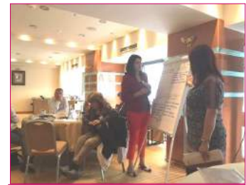
Predstavnici ORS-a su aktivno učestvovali u radu.

Svi učesnici poneli lepe utiske sa ovog skupa.