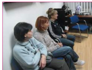
Učesnici radionica uvek rado dolaze na njih i aktivno učestvuju u radu.