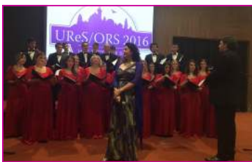
Kongres je otvoren uz operске аrije koje су певали хор из Ниша и позната оперска певачица.

Više od 300 učesnika, reumatologa, fizijatarata, lekara drugih specijalnosti, farmaceuta i pacijenata iz Srbije i inostranstva je bilo prijavljeno za četvrti Kongres UReS/ORS na Kopaoniku. Kongres je trajao od 14. do 17. septembra i obuhvatio je usmene i poster prezentacije na sledeće teme: