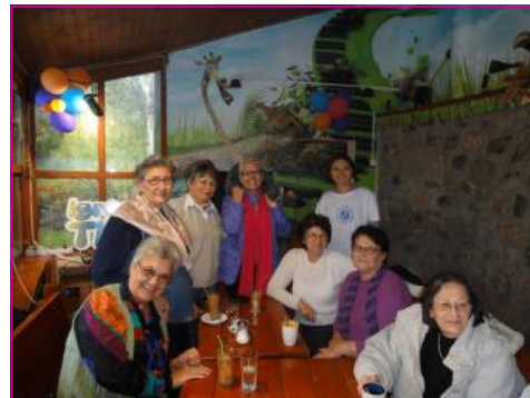
Uprkos lošem vremenu i putovanju do Beograda 12. oktobra je bilo dobro raspoloženje.