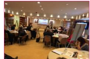
I predavanja i radionice su bile izuzetno zanimljive i poučne.